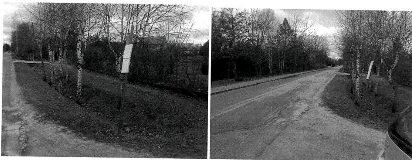
Zdjęcie nr 2,3 :istniejący przystanek ul Brzozowa