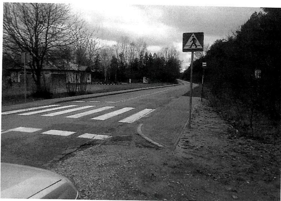
Zdjęcie nr 1: zmodernizowany przystanek ul. Brzozowa na wysokości domów komunalnych